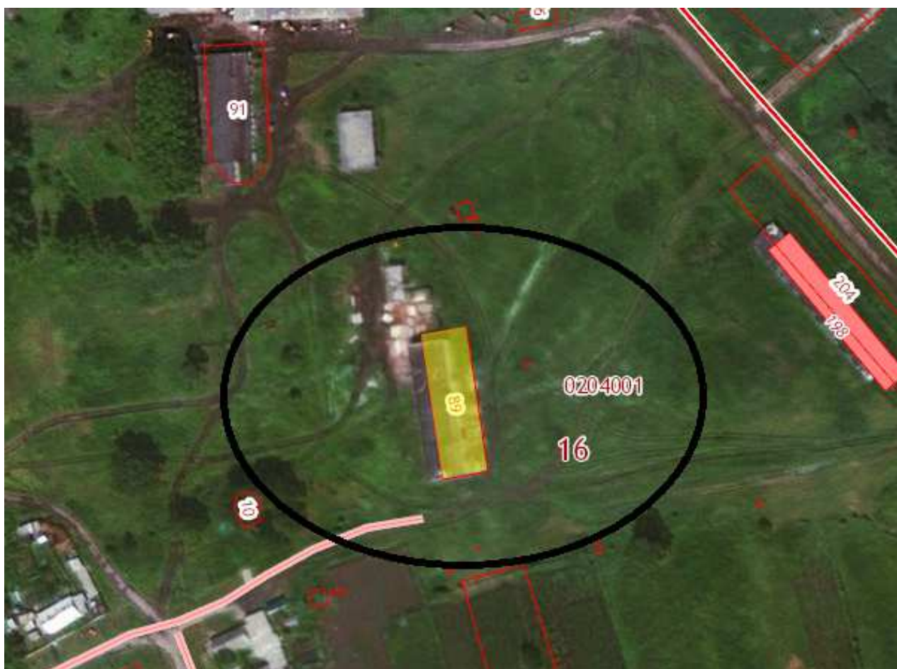
Рис.1 Обзорная схема размещения участка

Испрашиваемый участок расположен в северной части с. Маркелово вокруг участка с кадастровым номером 70:16:0204001:89, на котором располагается производственное здание. На кадастровом учете территория не стоит, ориентировочная площадь участка 1,2 га. (Рис. 1)