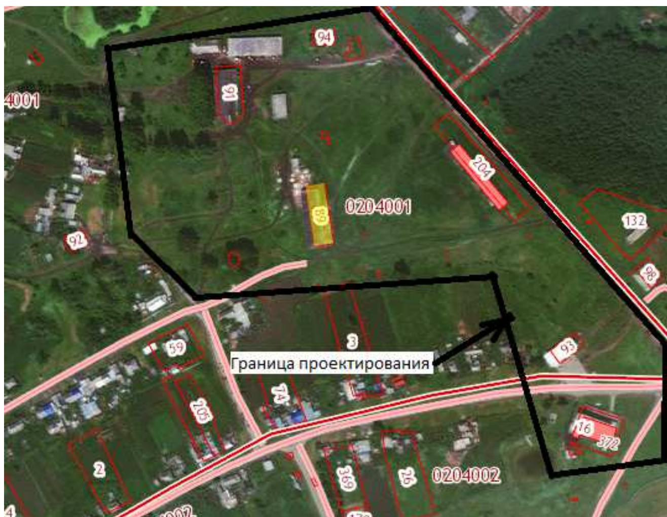
Рис.3 Схема практического расположения участков на проектируемой территории.

Проанализирован ситуацию на местности (Рис.3) и сравнил ее с действующей схемой градостроительного зонирования с. Маркелово (Рис.2) при согласовании Администрации Анастасьевского сельского поселения, проектом предлагается внести изменения в схему градостроительного зонирования с. Маркелово, а также в графические материалы генерального плана Анастасьевского сельского поселения в границах всего квартала населенного пункта с. Маркелово с целью приведения графических материалов Генерального плана и Правил землепользования и застройки действительному месторасположению участков, объектов, проездов на местности.